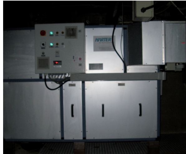
Schild Airgenex Aggregat 6000

Der Gestelltrockner mit Abmessungen von 3000 x 700 x 1250 mm besteht aus Polypropylen und produziert mit 10 Umluftventilatoren eine Umluftmenge von 60.000 m 3 /h. Daran angeschlossen ist ein Airgenex®-Entfeuchtungsaggregat, das – als flexibles System – aus Gründen der Platzersparnis im Keller installiert wurde. Mittels einer intelligenten Steuerung wird die Luftgeschwindigkeit je nach Art der Bauteile automatisch geregelt. Alle Werte wurden individuell programmiert, so dass eine optimale und bauteilbezogene Umluftzufuhr gewährleistet ist.