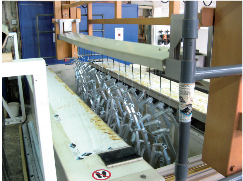
Schild Gestell beim Einfahren

Auch den qualitativen Anforderungen des Kunden konnte das Airgenex®-System gerecht werden. Die Taktzeit des alten Trockners betrug maximal 6 min. Jetzt verbleiben die Gestelle 3 min. im Trockner. Hieraus ergibt sich eine Zeitersparnis von bis zu 50%. Zudem werden die Bauteile in dieser kurzen Trocknungszeit vollständig getrocknet. Die niedrigen Temperaturen von lediglich circa 55°C wirken sich außerdem schonend auf die Produkte aus. Unnötiger und kostspieliger Ausschuss wird von Anfang an vermieden.