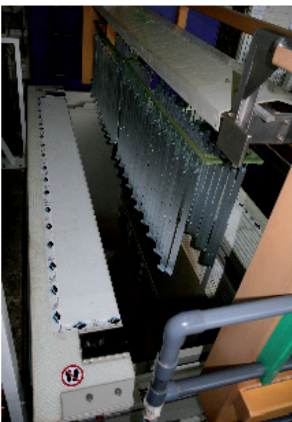
Schild Gestell beim Einfahren