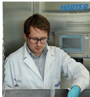
F&E mit Versuchstechnikum

Sie haben eine umfangreichere Aufgabe für uns? Gerne! Nach Absprache fertigen wir auch Versuchsaufbauten in größeren Maßstäben an. Die Analysen und Ergebnisse lassen wir dann direkt in unsere Planung einfließen und setzen sie entsprechend um.