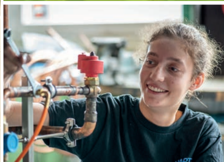
Kälteanlagenbau / Klimatechnik