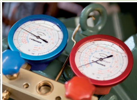
Vorabnahme/FAT, Montage, Inbetriebnahme