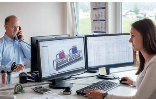
Engineering, Design und Konstruktion in 3D

Unsere qualifizierten und überwiegend regionalen Partner und Lieferanten versorgen uns mit ausschließlich erstklassigem Material und hochwertigen Dienstleistungen. Zu Ihnen pflegen wir langjährige und gute Geschäftsbeziehungen. All dies ist die Grundlage für unser erfolgreiches Schaffen.