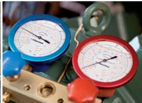
Vorabnahme/FAT, Montage, Inbetriebnahme