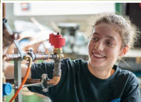
Kälteanlagenbau / Klimatechnik