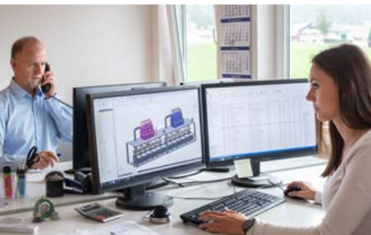
Engineering, Design und Konstruktion in 3D

Qualität in alle Richtungen Unsere qualifizierten und überwiegend regionalen Partner und Lieferanten versorgen uns mit ausschließlich erstklassigem Material und hochwertigen Dienstleistungen. Zu Ihnen pflegen wir langjährige und gute Geschäftsbeziehungen. All dies ist die Grundlage für unser erfolgreiches Schaffen.