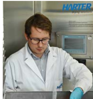
F&E mit Versuchstechnikum

Sie haben eine umfangreichere Aufgabe für uns? Gerne! Nach Absprache fertigen wir auch Versuchsaufbauten in größeren Maßstäben an. Die Analysen und Ergebnisse lassen wir dann direkt in unsere Planung einfließen und setzen sie entsprechend um.