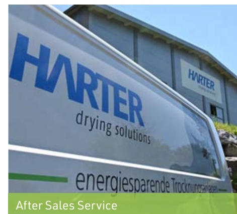
After Sales Service

Wir unterstützen Sie auch bei einem möglichen Umbau Ihrer Anlage, etwa wenn Sie ein anderes Produkt trocknen möchten, ohne ein komplett neues System installieren zu müssen.