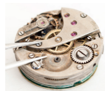
Teile für Uhrwerke