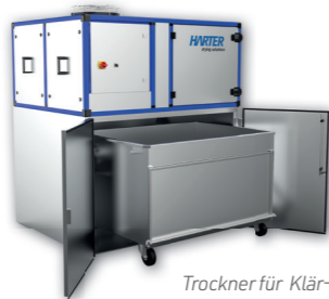
Trockner für Klär- oder Industrieschlamm