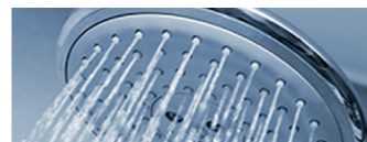
Wasserhähne und Duschköpfe