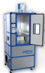
Kleiner Trockner für ganz kleine Uhrenteile