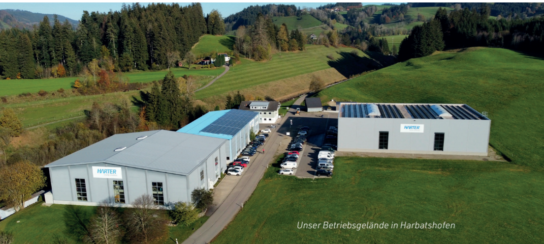
Unser Betriebsgelände in Harbatshofen

Das ist gar nicht einfach, und deshalb funktioniert das mit der Trocknung vieler Produkte während ihrer Herstellung in vielen Unternehmen auch nicht richtig. Und weil jedes Produkt anders anders ist, braucht es auch immer eine spezielle Trocknungsanlage. Die entwickeln und bauen wir bei Harter und stellen sie dann bei unseren Kunden auf. Seit über 30 Jahren sind wir die Spezialisten für Trocknung in Industrieunternehmen und mit 100 Mitarbeitern ein großer Arbeitgeber in unserer Region.