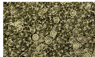
Nieten für Jeans

Was die meisten nicht wissen: viele Produkte werden irgendwann während ihrer Herstellung getrocknet, ganz oft mit einem Trockner von Harter. Hier sind ein paar Beispiele.