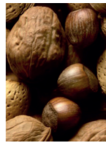
Nüsse und Schalenfrüchte