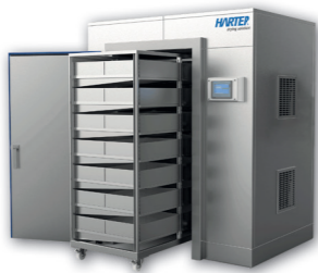
Im Kammertrockner lassen sich Salmisnacks prima trocknen