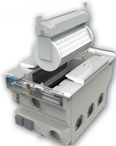
Für die Nieten an der Jeans ist ein Trommeltrockner perfekt