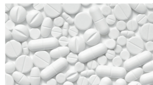
Tabletten / Wirkstoffe