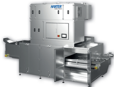
Bandtrockner, ideal zum Trocknen von Kräutern