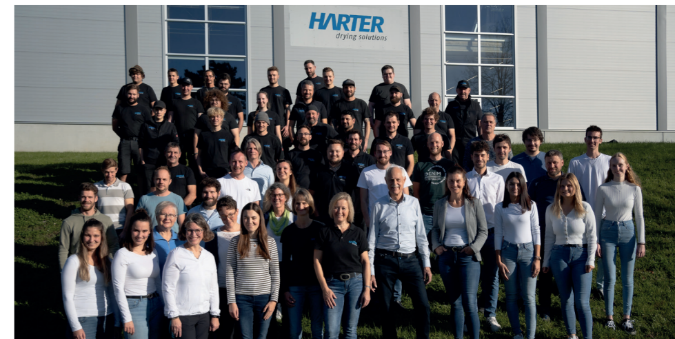
Das Team von Harter

Dafür brauchen wir vor allem eins: hochqualifizierte und motivierte Mitarbeiter, die wir am liebsten auch selbst ausbilden und denen wir viel bieten: ein faires Einkommen, gute Weiterbildungsmöglichkeiten und ein familiäres Arbeitsumfeld.