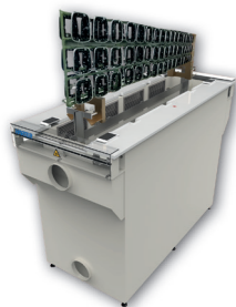
Mit einem Gestelltrockner werden Wasserhähne getrocknet

Unsere Kunden zeigen uns, was sie trocknen wollen, wie lange das dauern darf und wie das Ergebnis sein muss. Wir machen dann Versuche und bauen den passenden Trockner. Und so unterschiedlich wie die Gegenstände sind dann auch unsere Trockner, aber immer mit einer Wärmepumpe, um viel Energie und CO 2 zu sparen.