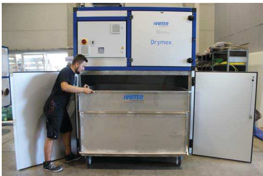
Abb. 5: Standard-Schlamm-trockner für 1000 kg pro Tag

Trocknung in der Trommel nicht möglich sei. Ein Beispiel zeigt Gegenteiliges. Bei einer Lohngalvanik wurde in einer neuen Trommelverzinkungsanlage auf das schädliche und zeitaufwendige Zentrifugieren verzichtet. Der in die Anlage inte-