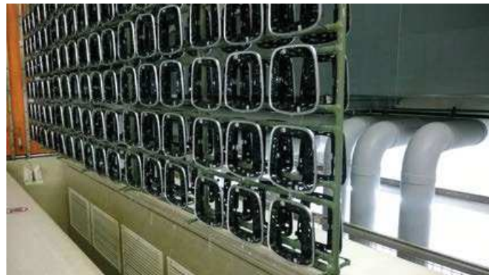
Abb. 1 und 2 zeigen Metall- und Kunststoffteile, die in Gestelltrocknern innerhalb der vorgegebenen Taktzeiten vollständig und schonend getrocknet werden

Herkömmliche Heißlufttrockner bringen oft nicht den gewünschten Erfolg. Die Trocknung ist deshalb vielerorts das Nadelöhr in der Fertigung. Und nicht selten sind die alten Trockner wahre Energieschleudern. Deshalb lohnt sich der Blick auf ein alternatives Trocknungsverfahren, das vom Staat als förderfähige Technologie eingestuft wurde.