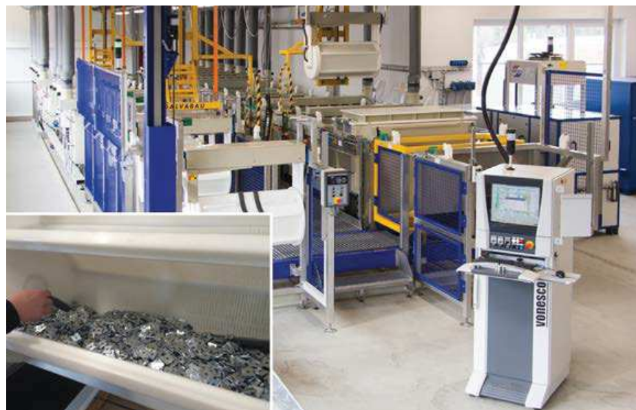
Abb. 3: Schüttgüter werden komfortabel und sicher im Behälter getrocknet. Die Trocknung direkt in der Trommel ist heute Stand der Technik.

Ein großer Meilenstein bei Harter war die Trocknung von Trommelware direkt in der Trommel, ganz statisch oder mit minimaler Intervallbewegung. Harter entwickelte dazu bereits 1996 eine besondere Halbschalentechnik. Zwischenzeitlich sind hunderte von Trommelrocknern realisiert worden, obwohl sich mancherorts hartnäckig die Meinung hält, dass die